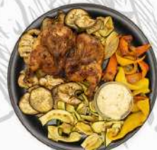
GALLETTO VERDURE ALLA GRIGLIA 13,9 DOPPIO CONTORNO 15,5