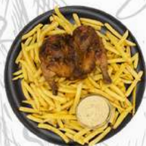
GALLETTO PATATINE FRITTE 13,5 MEZZO GALLETTO 8,9