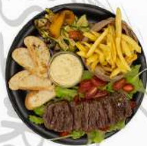
TAGLIATA ANGUS LUNGA FROLLATURA OLIO EVO E SALE MALDON DOPPIO CONTORNO 18